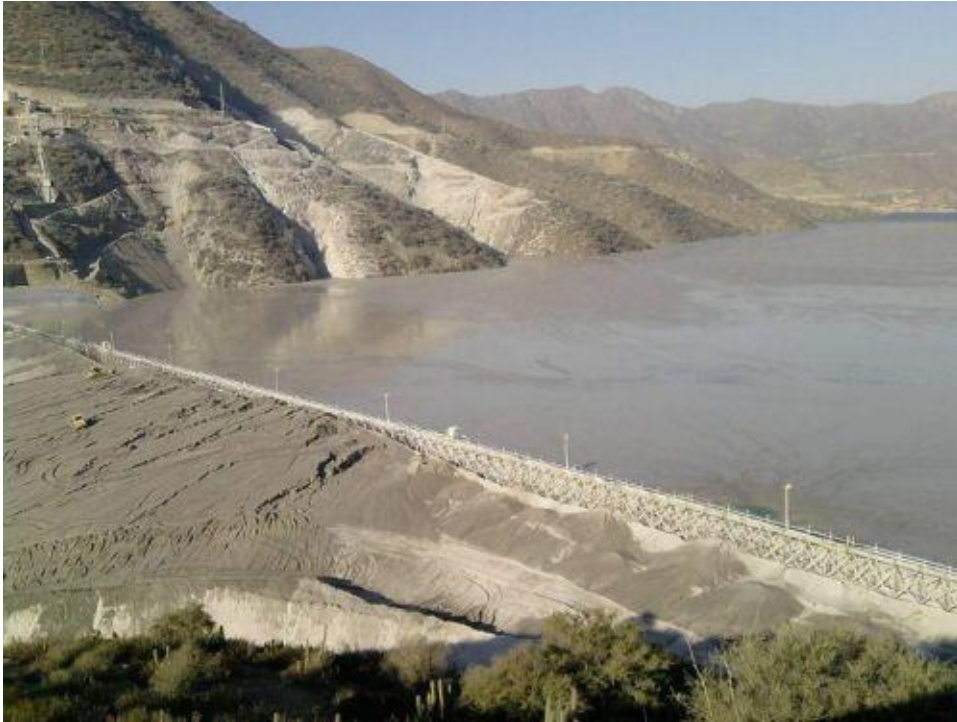
Kuva 2: Chilen mineraalilouhinnan saastuttama vesistö pohjois-Chilessä Caimanesin kylässä vuonna 2012.